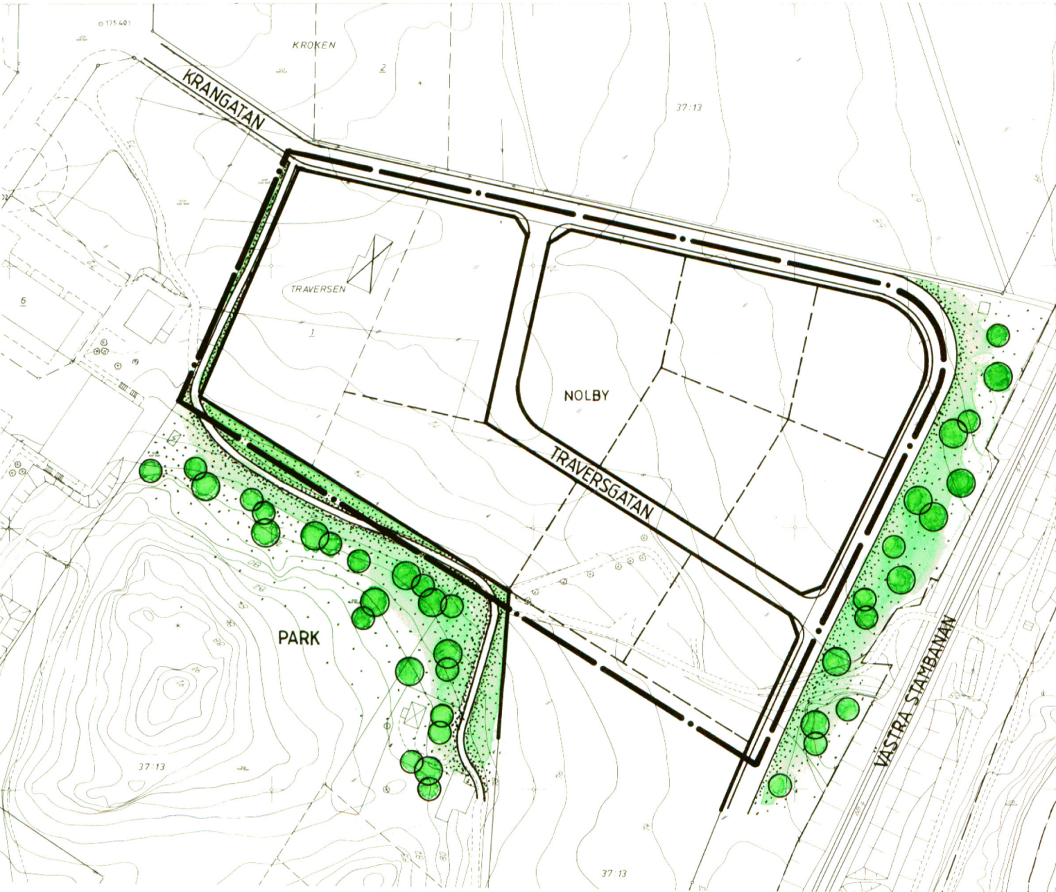
ILLUSTRATIONSKARTA SKALA 1:2000 0 50 100 M